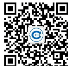
中检深圳公司微信