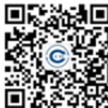
中检电商中心微信