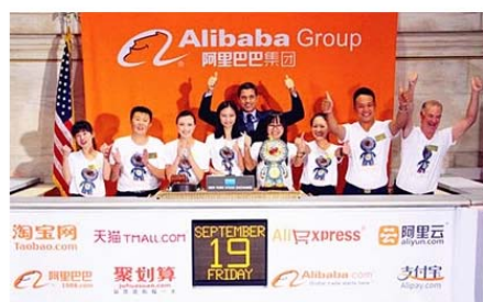
左图：阿里巴巴上市 8 名客户代表敲响开市钟

除此之外，中检集团目前已与国内其他电商巨头如京东、苏宁易购、腾讯、百度微购、中粮我买网、中国制造网、网盛生意宝等建立了战略合作关系，实现了多元化的业务合作模式。随着阿里巴巴、百度、京东等不断走出国门，迈向世界舞台，中检集团也将不遗余力加深与各大电商平台的合作，为营造健康诚信的电子商务环境作出努力，也为高速发展的国内电商行业打造“中国质量”品牌，不断走向世界舞台助力。