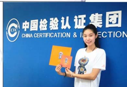
右图：中检集团电商运营中心客服人员收到阿里巴巴上市纪念T恤